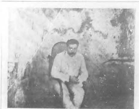
Coronel Félix Díaz

En la foto actual tomada durante la revolución contra el Presidente Madero, en Méjico, en la misma la prisión en que fue recluido al ser preso, fracasada su primera intentona en Veracruz.