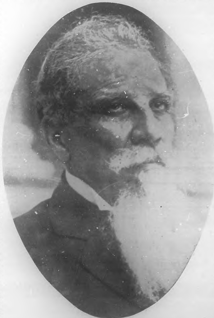
† GENERAL BERNARDO REYES

Candidato á la Vice Presidencia de la República en 1904 apoyado por núcleos poderosos de electores el Gral. Porfirio Díaz ¡funesto error! opuso á sus candidatura la de uno de sus íntimos: el Sr. Ramón Corral. Los hombres previsores de la República hermana fueron remisos en hacer acto de adhesión á aquel movimiento eminentemente popular y sin color partidista y el General Porfirio Díaz fado en su legítimo prestigio estimó como "simpatía platónica" tan importante síntoma sin concederle la importancia que en realidad tenía. Si bien aconsejado el General Porfirio Díaz hubiese interpretado en justicia y oportunamente "las señales de los