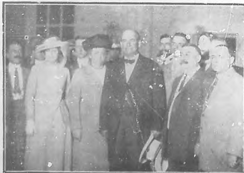
Llegada de Mr. Bryan — Momentos después de desembarcar, rodeado de las personas que fueron á recibirle.