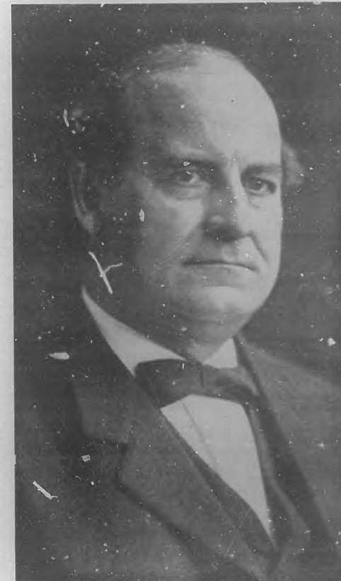
Honorable Mr. William Jennings Bryan.

No cree Bryan en el destino providencial de su país como mentor de otros pueblos, dominador de otras razas, potencia severo de otras naciones. Entiende que la misión exterior de los Estados Unidos ha de derivarse de su propia virtud y eficiencia, por la irradiación de su arte, su cien-